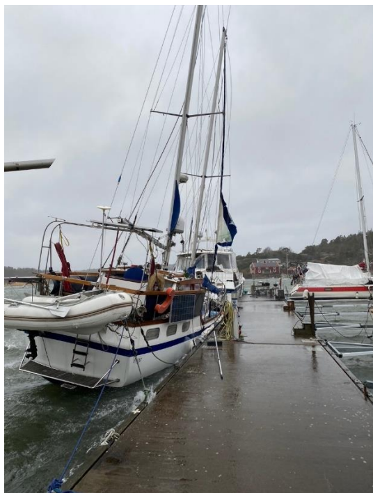
En kulen höstdag i hemmahamnen Kolhättan

På somrarna har det blivit lite segling till Danmark, men efter några dagar i Danmark brukar det vara ganska skönt att slippa sanden och komma tillbaka till de Bohuslänska klipporna och fantastiska skärgården, även om en avstickare till Läsö kan vara trevligt. I sommar är siktet inställt på att segla söderut och runda Skåne för att känna av Östersjön.