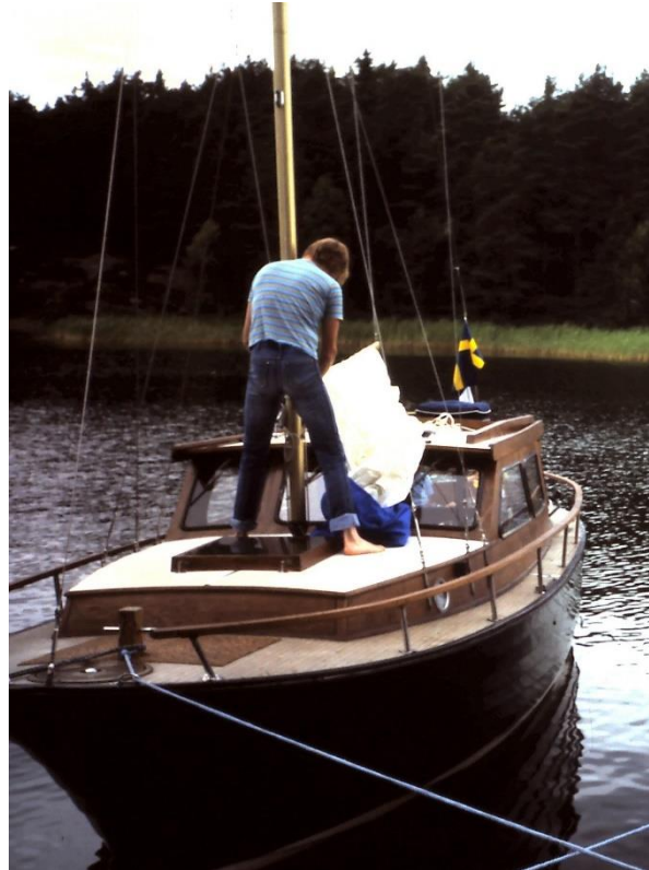
Minttu - MiniCat 25 årsmodell 1974

År 1995 träffade vi några finska Nauticatägare i Mariehamn och blev inbjudna på deras kräftska och blev även medlemmar i Nauticat Club Finland som sedermera upplösts och blivit en Facebook-grupp.