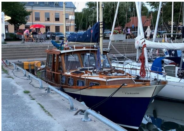
Victoria i ursprungligt skick med överbyggnad i trä.