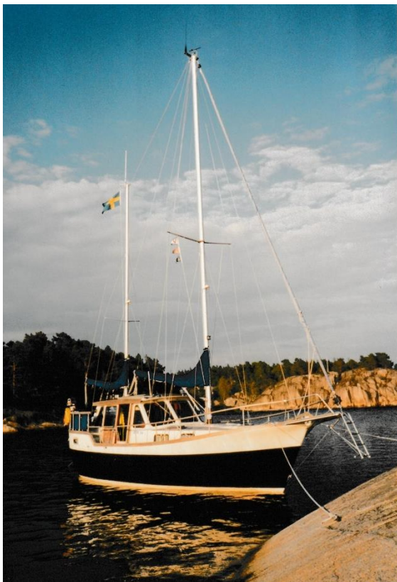
La Gatta – NautiCat 33 årsmodell 1981