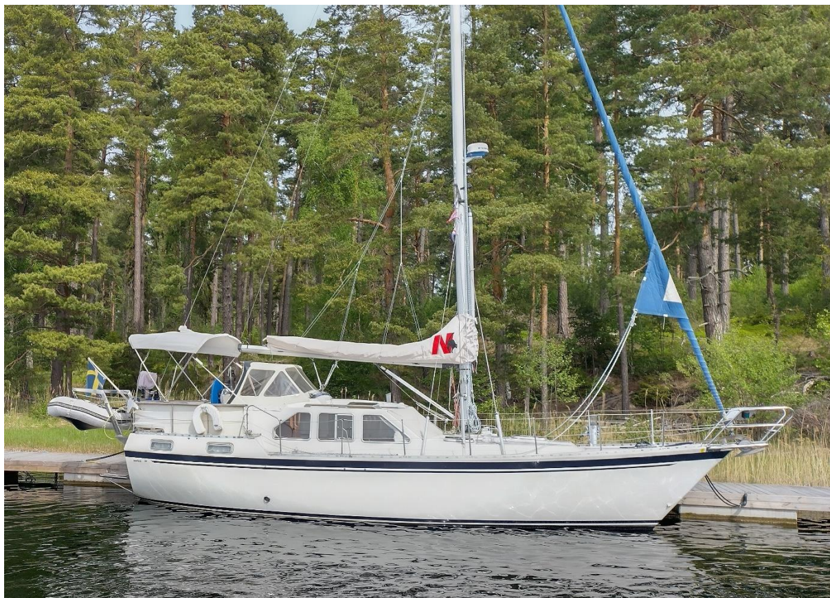
Caticsa -Nauticat 35 årsmodell 1987