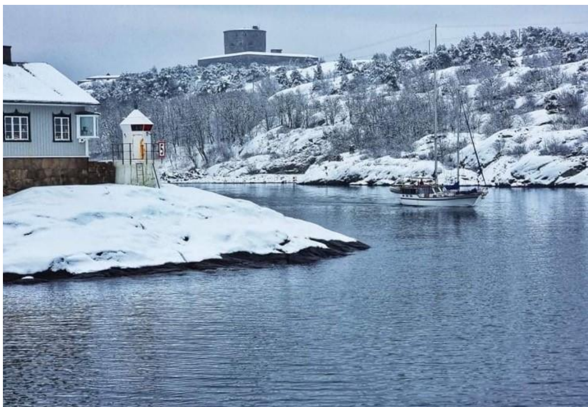
Just passerat Marstrand med Carlstens fästning