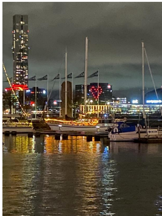
Nyårsafton vid Lilla Bommen i Göteborg